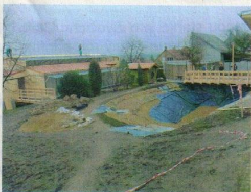
Pohled na centrální část expoziční části Stanice s budoucím jezirkem.

Zásadní událostí v tomto roce pro nás byla dostavba nového léčebného areálu nedaleko obce Pavlovice. Od července tohoto roku, kdy jsme jej začali užívat, jsme se už zabydleli a areál již plně funguje. Nyní zde kromě zvířecích pacientů jsou také trvale handicapovaná zvířata přestěhovaná z expoziční části Stanice z centra Vlašimi, kde se finalizuje rekonstrukce expozičních voliér. Jak výstavba léčebného areálu, tak rekonstrukce expoziční části Stanice probíhaly za finanční podpory evropských fondů. Předpokládané slavnostní otevření obou částí Stanice je předběžně plánováno na 22. duben 2012 a budeme Vás o něm jistě informovat.