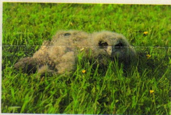
Mládě výra velkého s ochrnutýma nohama. Dnes již zpět na svobodě.

Vypouštění zvířat do volné přírody se v tomto roce stalo velmi populární u veřejnosti, pro kterou jsme za účelem osvěty pořádali deset vypouštěcích akcí. Více o těchto akcích se dočtete na našich internetových stránkách www.pomoczviratum.cz , kde zároveň včas informujeme o konání dalších vypouštěcích, ale i jiných akcí, kterých se můžete také zúčastnit.